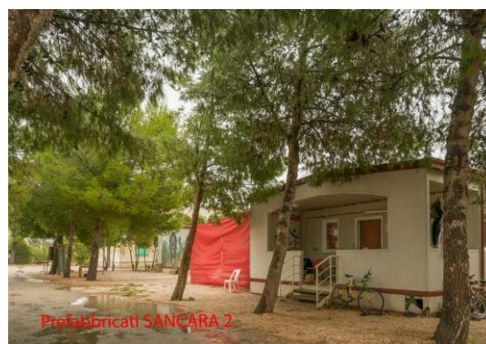
Prefabbricati SANCARA 2