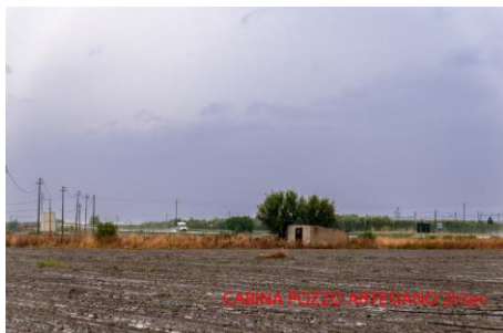
CABINA FORO ARMENTIZIO 2000