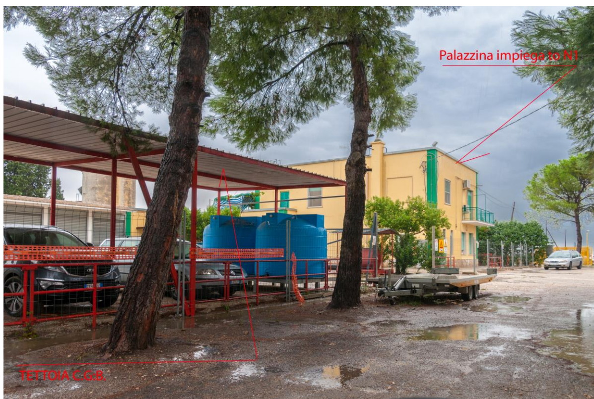
Palazzina impiego to N1