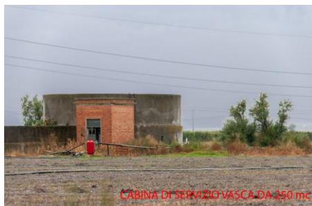
CABINA DI SERVIZIO VASCA DA 250 mc